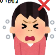
そのまま咳をする