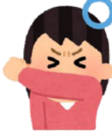
そで で鼻と口を覆う