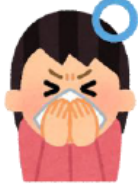
ハンカチやタオル で鼻と口を覆う